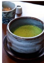
神楽坂 茶寮「抹茶ラテ」(イメージ)

「神楽坂 茶寮」の人気メニュー「抹茶ラテ」をイメージしたMilky。抹茶ラテにお好みで黒みつを入れて飲むスタイルを生かし、見た目も美しいハーフ&ハーフ(抹茶と黒みつ)に仕上げました。やさしいミルクの味わいに、「京都府産石臼挽き宇治抹茶」と、沖縄産の黒みつを使用した、抹茶の豊かな風味と黒みつのコクを合わせた抹茶ラテ味です。