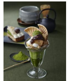
神楽坂 茶寮「お茶香る茶寮の和パフェ」(イメージ)

「神楽坂 茶寮」の人気メニュー「お茶香る茶寮の和パフェ」をイメージしたカントリーマアムです。「京都府産石臼挽き宇治抹茶」が抹茶の風味をしっかりと表現し、かくし味の北海道産小豆のあんが、和パフェらしさを引き立てます。また、チョコチップとホワイトチョコチップの2種類を使用することで、パフェのアイスクリームのイメージに近づけました。