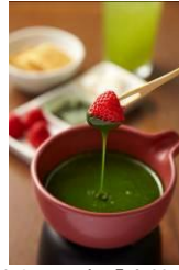
神楽坂 茶寮「京抹茶のチョコレートフォンデュ」(イメージ)

「神楽坂 茶寮」の人気メニュー「京抹茶のチョコレートフォンデュ」をモチーフにした2つの味のルック。宇治抹茶クリームに、フォンデュの付け合せのパイをイメージして、焼いたクレープを細かく砕いたフィアンティースを混ぜ込んだ「サクサク抹茶」。濃厚な抹茶フォンデュをイメージして、宇治抹茶クリームと宇治抹茶ソースを合わせた「とろ〜り抹茶」。「京都府産石臼挽き宇治抹茶」を使用した本格的な抹茶の味わいと、チョコレートフォンデュのおいしさを堪能できる商品です。