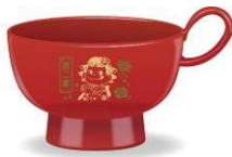
「ペコのデザート碗」

対象商品のバーコード3枚1口、または2枚1口としてご応募いただくと、選べるグルメまたは、ペコのデザート碗&不二家のお菓子詰め合わせ&神楽坂茶寮茶葉が合計70名様に当たります。